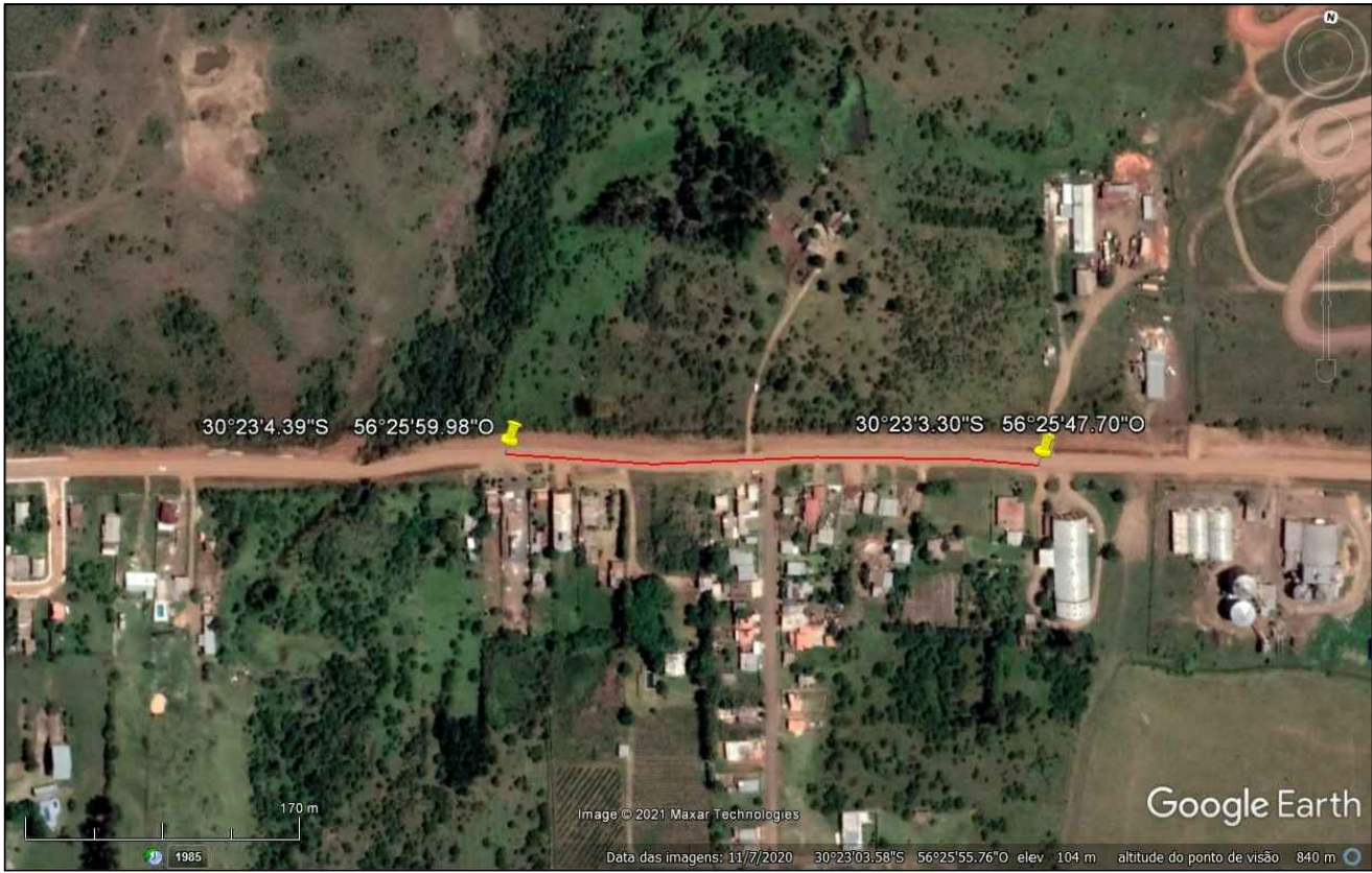
2 LOCAL DE PAVIMENTAÇÃO SEM ESCALA